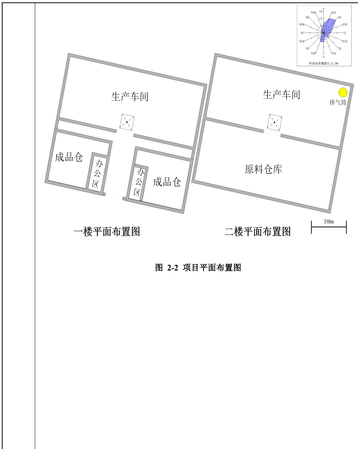
图 2-2 项目平面布置图