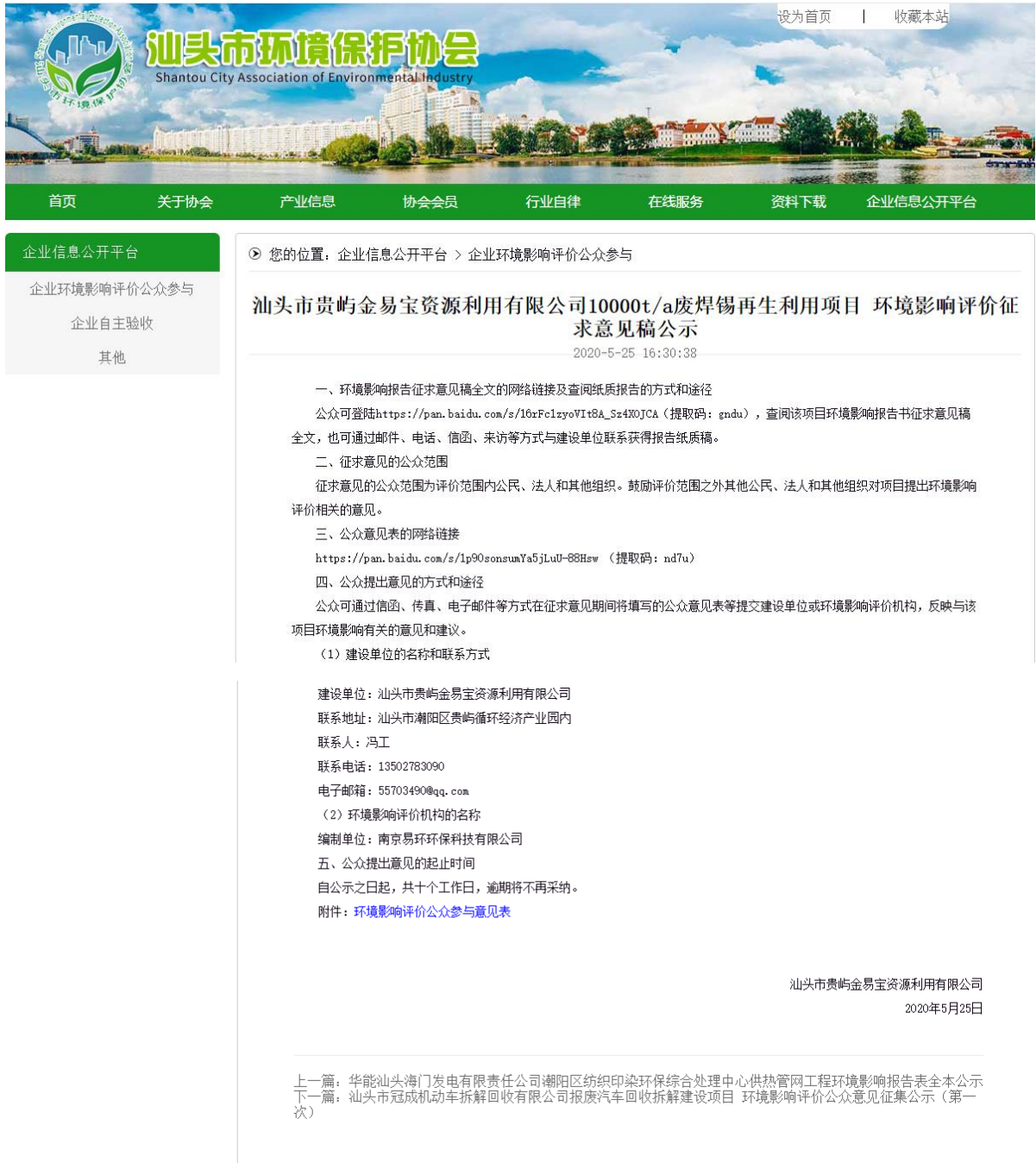
图 3-1 征求意见稿网络公示情况