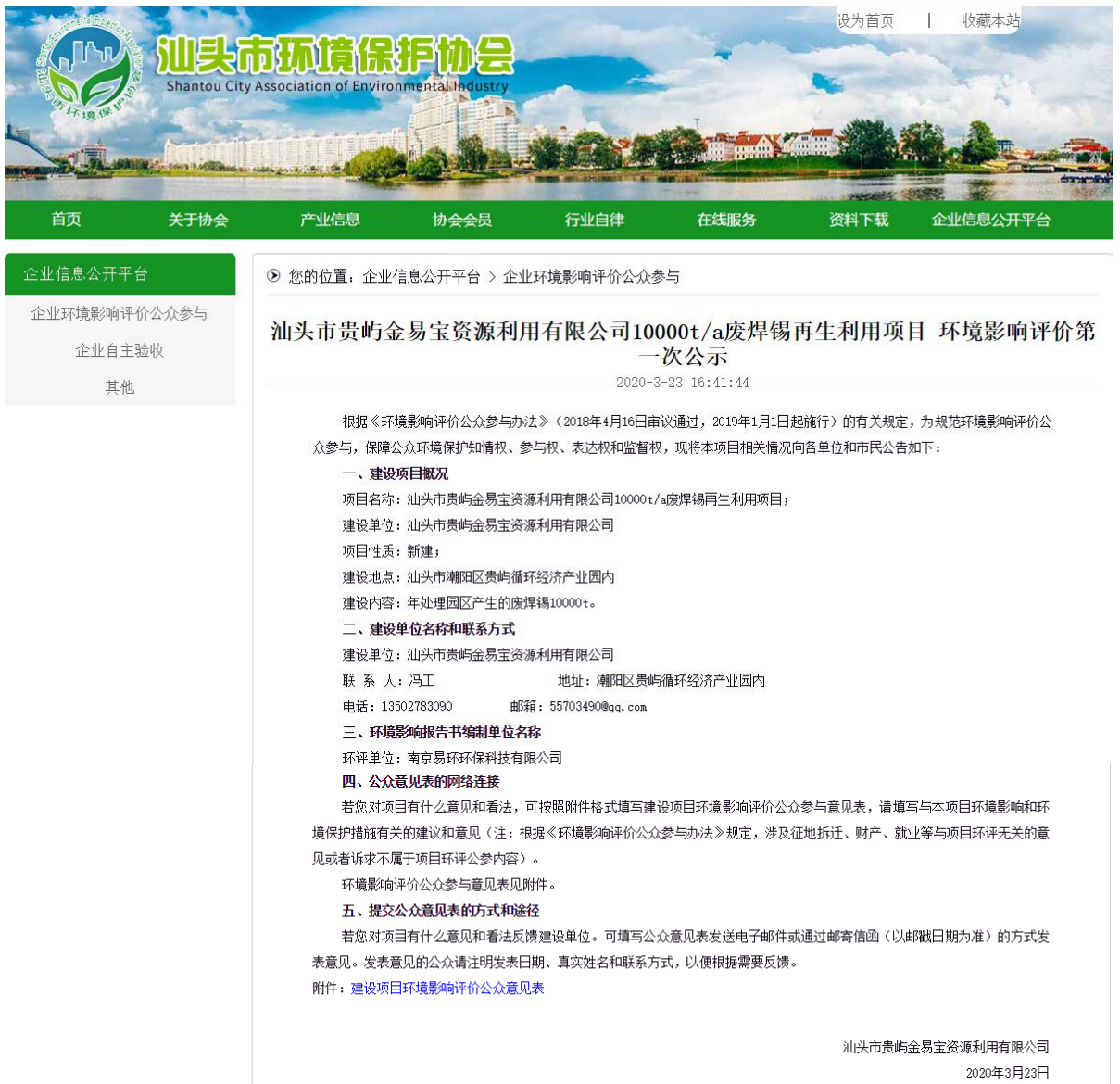
图 2-1 环境影响评价第一次公示网络截图