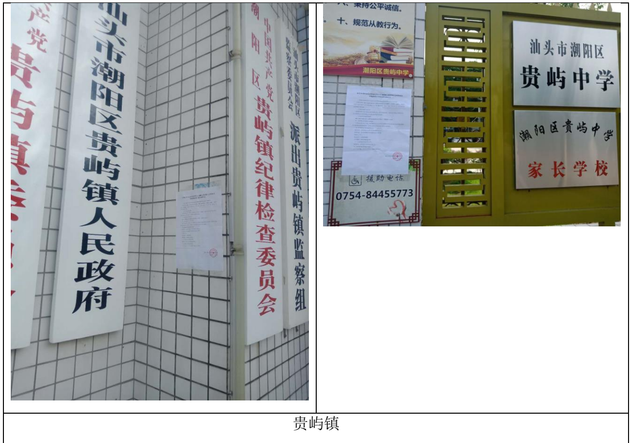
图 3-2 征求意见稿公告公示